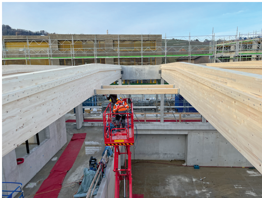
↑ Nacelle ciseaux du chantier « Extension du collège de Féchy »

tion officielle de la formation à la conduite des PEMP dans le cursus des apprentis charpentiers en Suisse. Auparavant, l'obtention de cette certification n'était pas systématique dans le cadre de leur formation initiale (Référence: FRECEM, Plan de formation et annexe 2 CFC 2024, sous la rubrique : Modifications du plan de formation.)